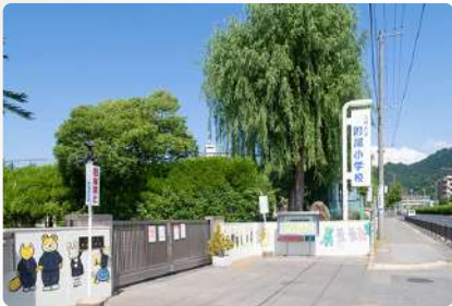
山形大学附属小学校 I : 約950m (徒歩12分)、II : 約1,000m (徒歩13分)

第一中学校 徒歩 13~15 分 I : 約1,000m (徒歩13分)、II : 約1,200m (徒歩15分)