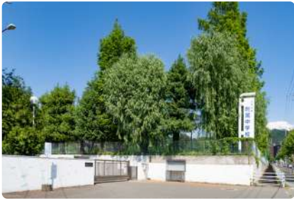
山形大学附属中学校 I : 約950m (徒歩12分)、II : 約1,000m (徒歩13分)