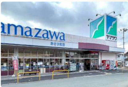
ヤマザワ あさひ町店 I : 約950m (徒歩12分)、II : 約1,100m (徒歩14分)

スマートハイムプレイス 小白川町四丁目 I MAPCODE 273 568 842*61 | スマートハイムプレイス 小白川町四丁目 II MAPCODE 273 597 029*57