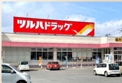
ツルハドラッグ 山形小白川店 I : 約650m (徒歩9分)、II : 約400m (徒歩5分)